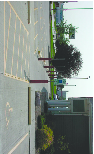
Arriba: Ejemplo de un espacio de estacionamiento accesible que cumple con la ley de Illinois.

Cualquier instalación que ofrezca estacionamiento para empleados o visitantes debe proporcionar estacionamiento accesible a personas que tengan discapacidades. Un espacio de estacionamiento accesible consiste de un espacio para vehículo y un espacio de acceso marcado con rayas. En todo momento, todo el espacio debe mantenerse libre de obstrucciones, incluso hielo, nieve, carros de compras, recipientes para basura, plantas en macetas, y soportes para estacionar bicicletas.